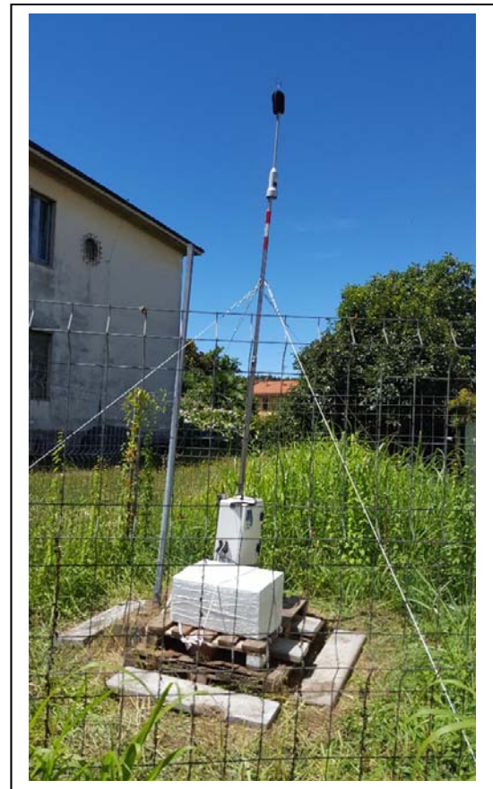
Figura 4: Posizionamento della centralina mobile - La strumentazione di misura è stata installata nel giardino retrostante la struttura.