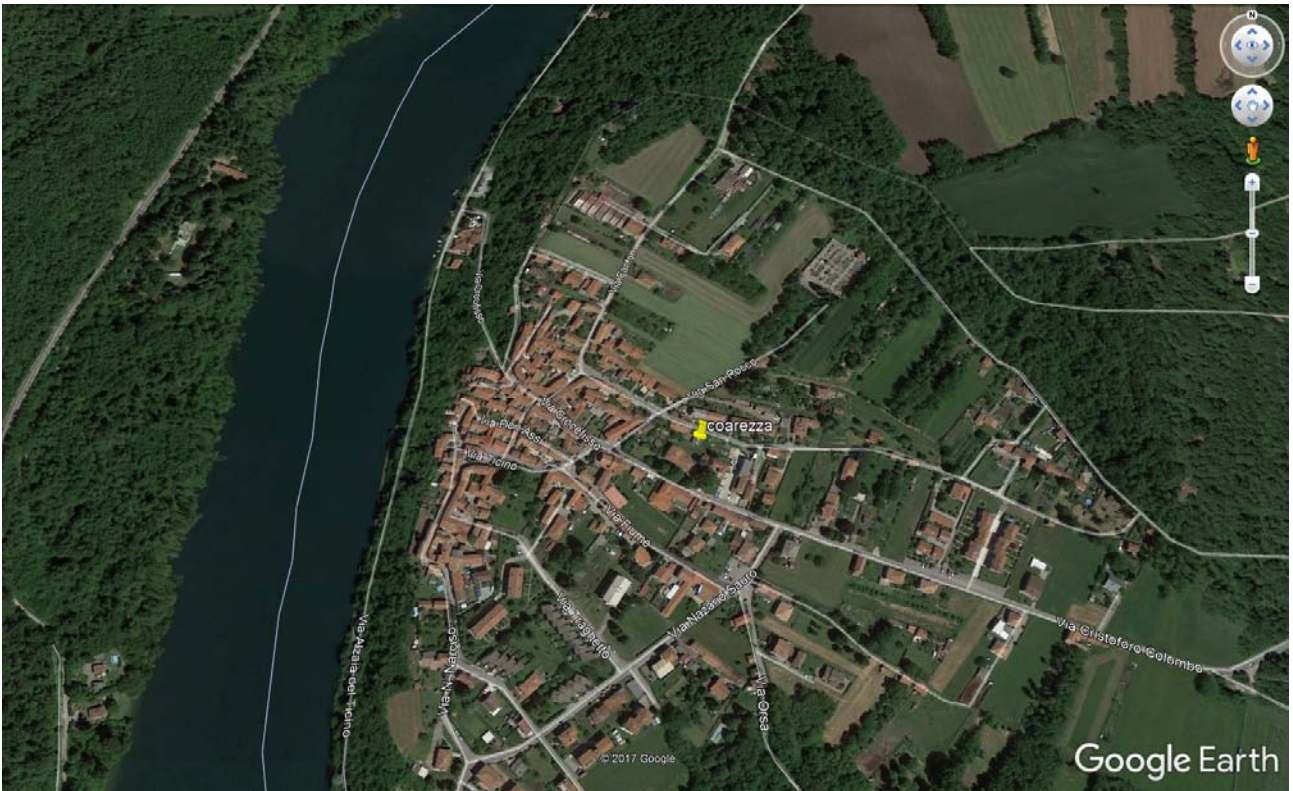
Figura 2 : Posizionamento del punto di misura.